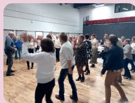
Soirée dansante du 18 novembre 2023.

Si vous êtes retraité(e), n'hésitez pas à venir nous rejoindre, nous sommes