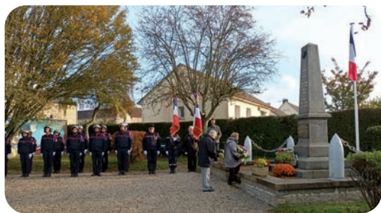
Saint Denis, sous un ciel clément a commémoré avec ferveur ses enfants morts pour la France.

En France, 1,4 million de morts, sans oublier les gueules cassées, tous ces soldats amputés, nous avons une pensée pour toutes ces veuves et orphelins.